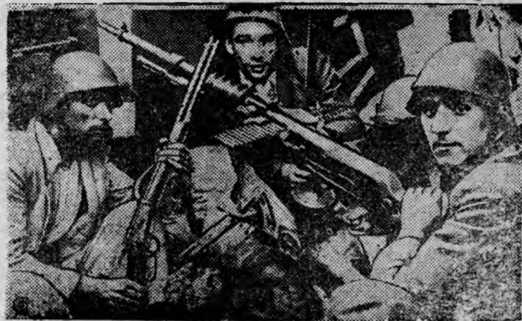
Организованная рабочими милиция поназывает чудеса храбрости и энтузиазма в боях с фашистскими мятежниками. НА СНИМКЕ: Отряд рабочей милиции у пулемета.