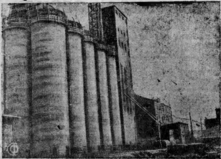
В гор. Фрунзе (Киргизия) построен элеватор на 500 вагонов зерна. НА СНИМКЕ: Вид элеватора в городе Фрунзе.