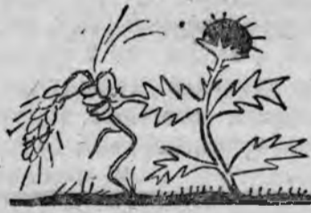
Где сева правила нарушат, Там колос сорняки задумат.

Не удовлетворительно поставлена массовая работа. Нет борьбы за выполнение норм выработки. В таком колхозе, как „Искра труда“ пахари выполняют норму только на 50-60 проц. выезжают на работу поздно лошадей кормят только 1 раз. Такая-же картина наблюдается и в ряде других колхозов.