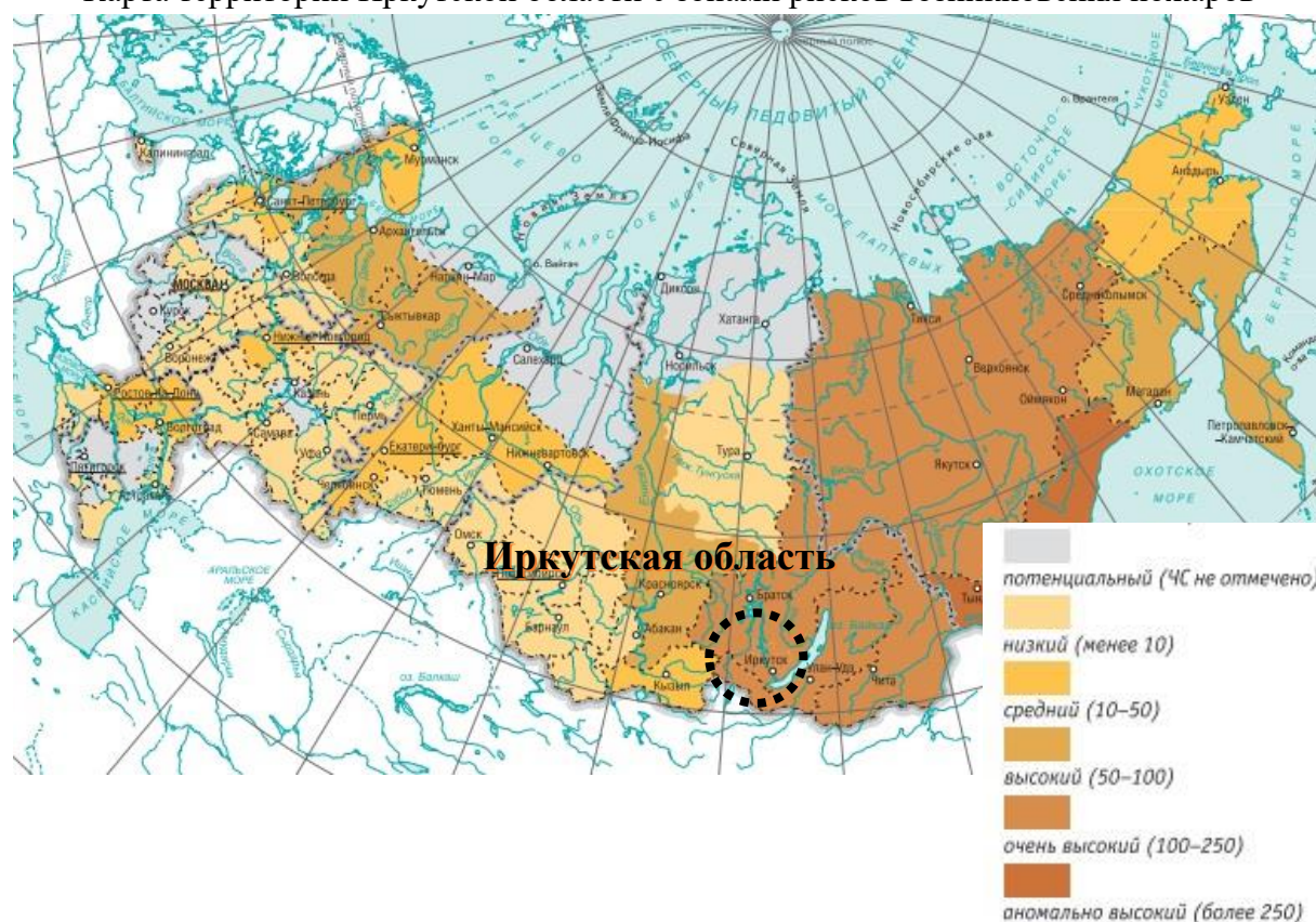
Карта территории Иркутской области с зонами рисков возникновения пожаров