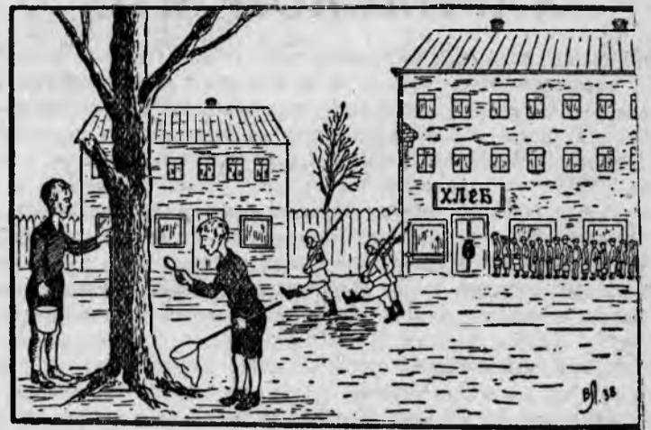
—По-моему это хлебное дерево, ведь из его опилок выпекают хлеб. Рис В. Лисевич («Прессклише»)