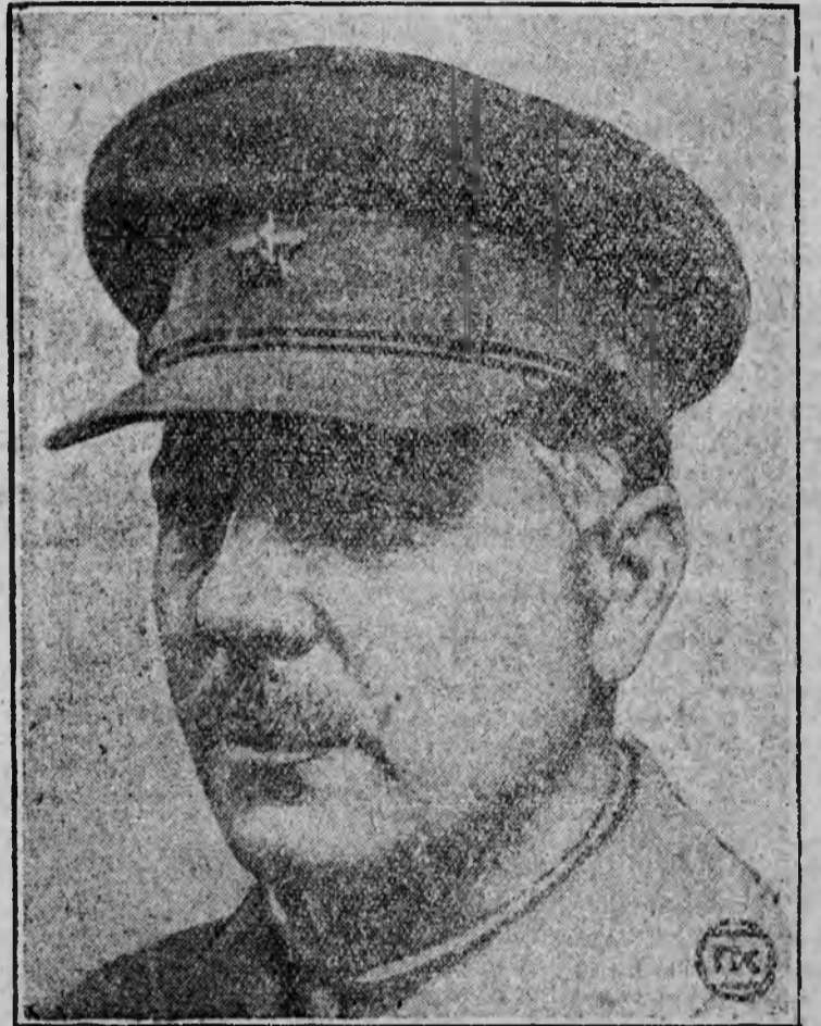
19-го августа вечером т. Ворошилов прибыл в г. Иркутск.

В порядке обсуждения внести предложение, совершенно отказать от вязки хлеба в снопы, а через определенный короткий срок 1-2 дня после снятия хлеба с жатки возить его под молотилку. Это мероприятие сократит затраты труда на вязку, избавит от лишней потери зерна, обеспечит бесперебойную уборку и молоту и сократит сроки уборки. Применение этого опыта в сельском хозяйстве дало лучшие положительные результаты. ПАДУКИН