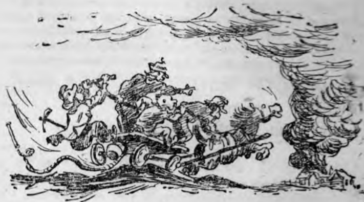
— Ну, вот и хорошо — еще горит. На этот раз, кажется, мы не опоздали...