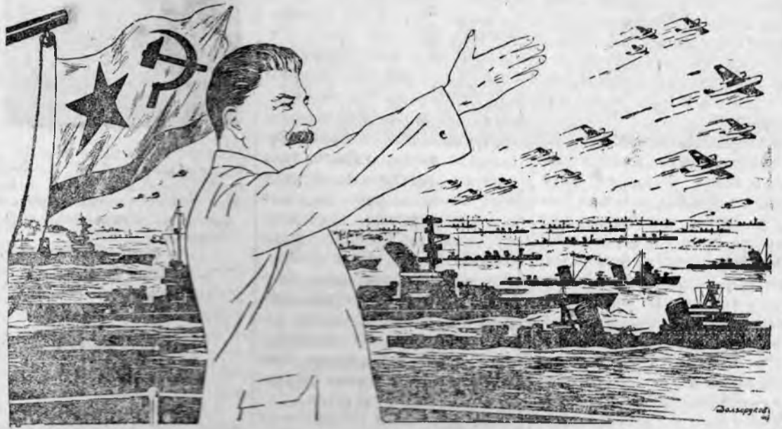
Рисунок художника Н. А. Долгорукова.

Это замечательное проявление патриотизма рабочего класса возлагает на нас, воинов страны социализма, огромную ответственность. Советские моряки будут не побоясь рук работать над дальнейшим укреплением и совершенствованием Красного Военно-Морского Флота, чтобы суметь в любую минуту с честью выполнить свой священный долг перед нашей любимой матерью-родиной.