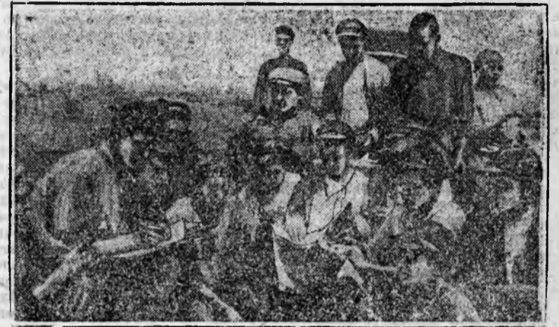
НА СНИМКЕ: В машинно-тракторной бригаде Краснокутской МТС подсчитывается дневная работа и заносится в труднижку

Этот вопрос должен стать отражением широчайшей массовой работы среди колхозников и единоличников, могучим рычагом мобилизации масс на борьбу за быстрейшее разрешение животноводческой проблемы и его важнейшей опоры кормовой—базы быстрейшее 100% выполнение планов сенокосения и силосования, за решительное преодоление сопротивления кулацких элементов и их право—„левой“ агентуры.