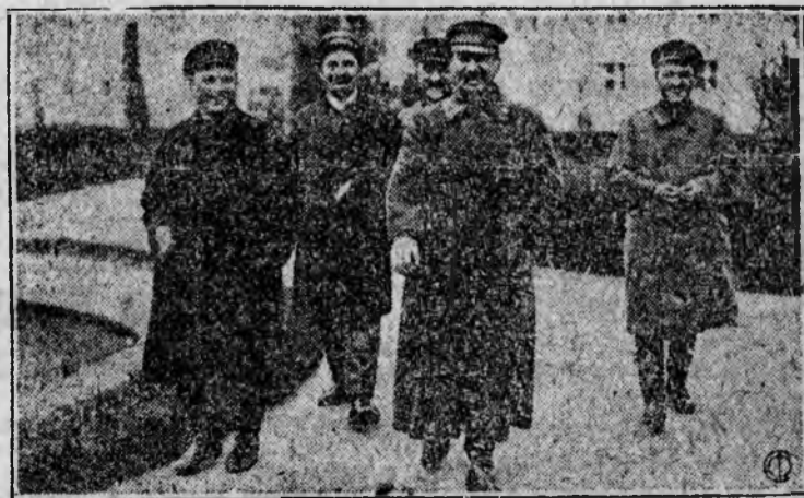
НА СНИМКЕ: Т.Т. Сталин, Каганович, Киров, Орджоникидзе и Миноян возвращаются с парада физкультурников

На угрозу империалистов ответим полной реализацией билетов 6-й авиолотереи—дадим на укрепление обороноспособности 2 миллиона рублей