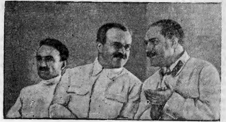
На снимке: (слева направо) А. И. Микоян, В. М. Молотов и Л. М. Каганович в ложе Совнаркома на первом заседании сессии.