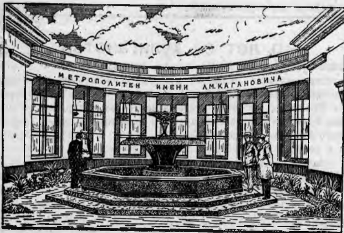
На Снимке: У входа в метро станции «Сокол».